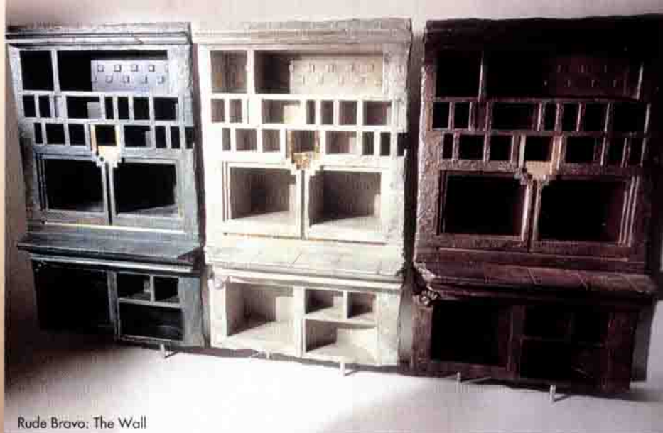
Rude Bravo: The Wall

Rude Bravo is a place where homage is paid to dreams and fantasies. Here rags and bones are transformed into objects. All that the market doesn't demand. All that is repelling to distribution. All that subverts the marketing-mix. There's always someone ready to buy fantasy. As long as it's top quality.